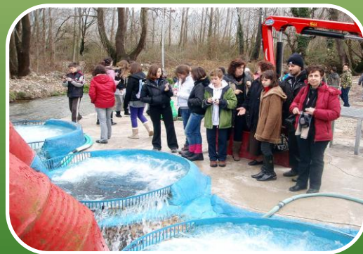
Υδροκίνηση – Νεροτριβές, Νερόμυλοι