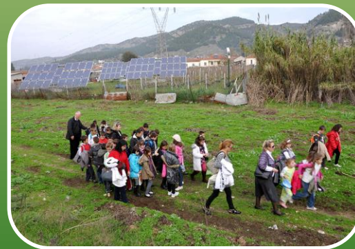
Κλιματική Αλλαγή – ΑΠΕ - Ανακύκλωση