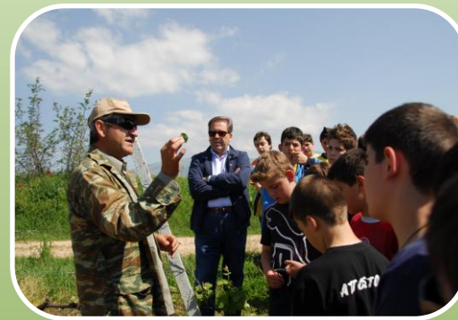
Βιολογική Γεωργία, αρωματικά και φαρμακευτικά φυτά