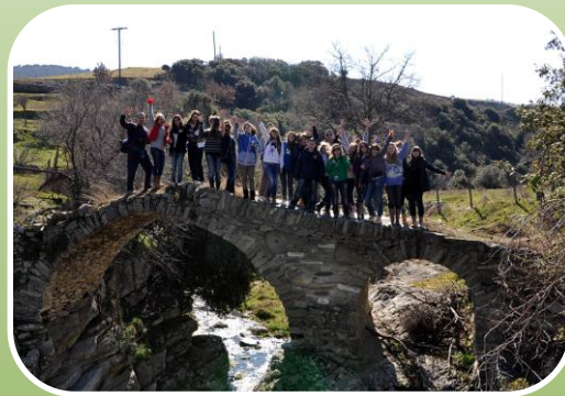
Παραδοσιακή αρχιτεκτονική - Πετρογέφυρα