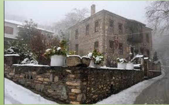
Αγιά και Παρακισσάβιες περιοχές