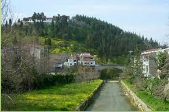
Ελασσόνα & Παραλύμπιες Περιοχές